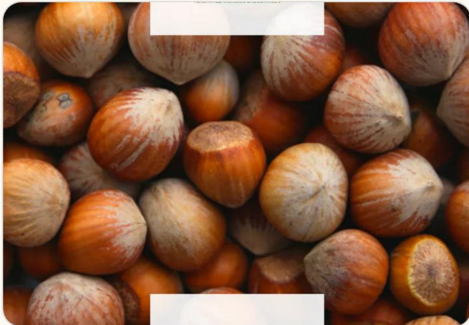
La Nocciola Romana

L'oro della zona: varietà Gentile Romana, perfetta per dolci e tozzetti.