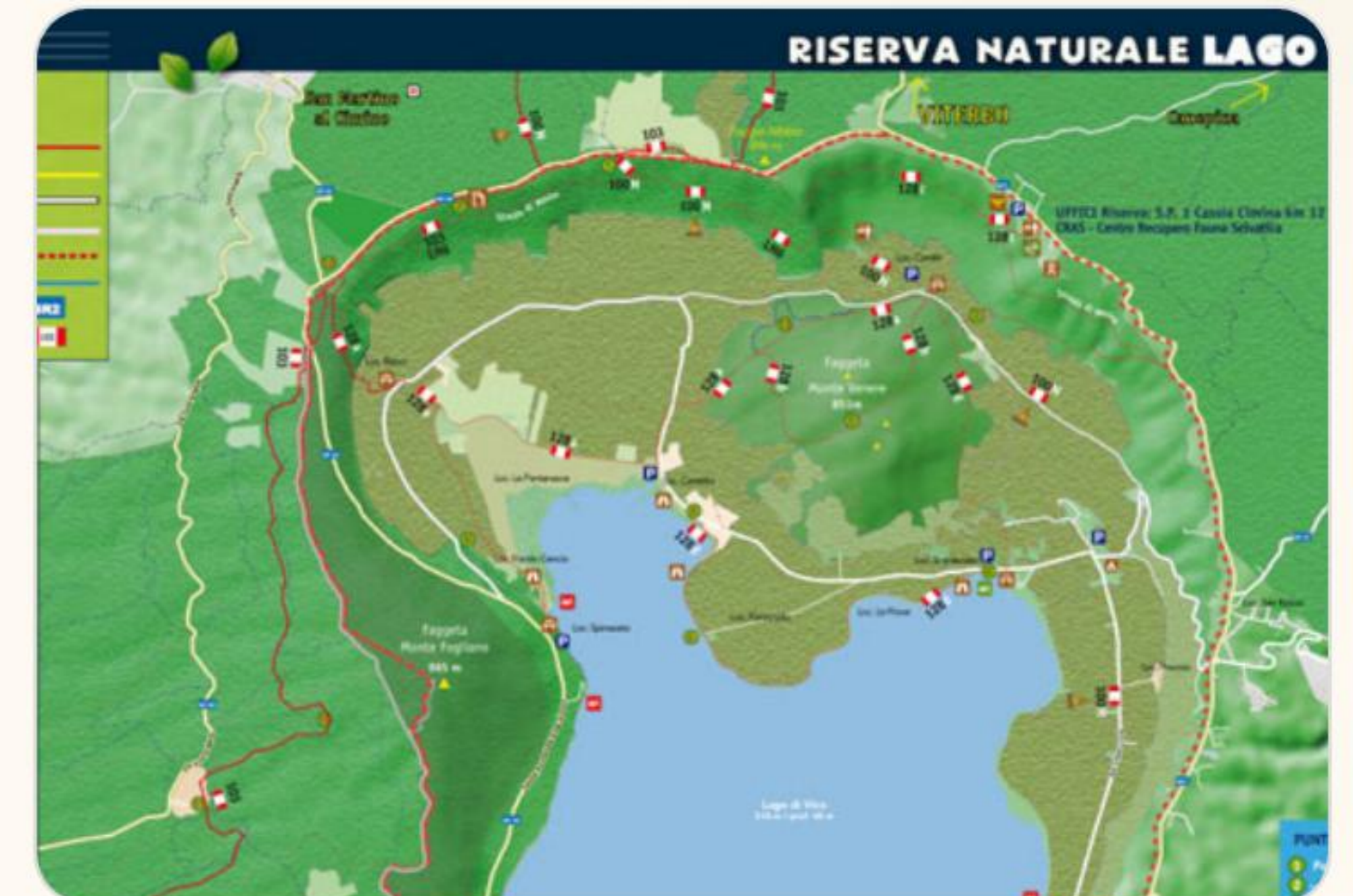
I Marroni dei Cimini

Il pesce principe del lago, pescato quotidianamente e cucinato alla griglia o al forno.